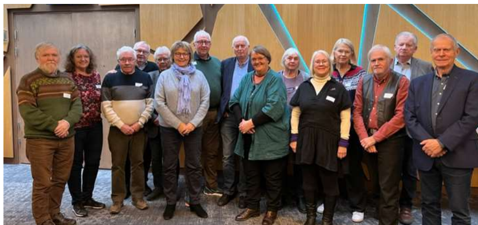
Regionlagsledersamling 28. oktober 2023.