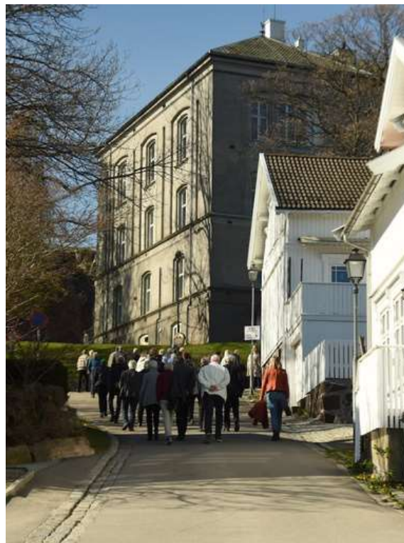
Tur i Tønsberg.