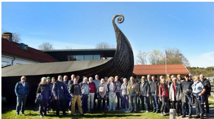
Utflukt til Slottsfjellsmuseet.